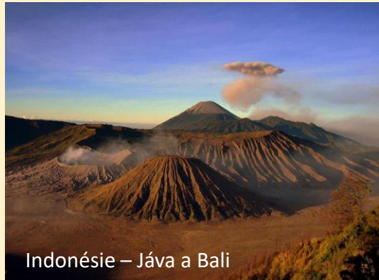
Indonésie – Jáva a Bali